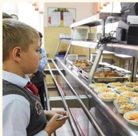
Учащиеся 1 - 4 классов