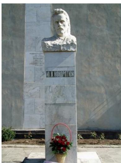
Бюст Ю.В. Кондратюка в ст. Октябрьской