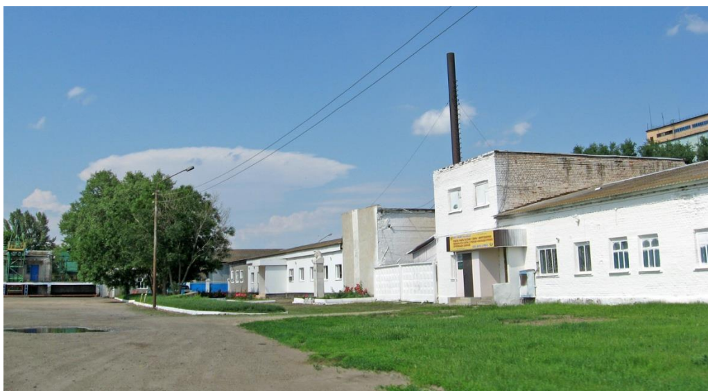
Современный вид Крыловского элеватора

В мемориальный комплекс Ю.В. Кондратюка вошли: мраморный бюст, мемориальный музей, улица его имени и еще школьный музей авиации и космонавтики СШ № 20 (ныне СОШ №6).